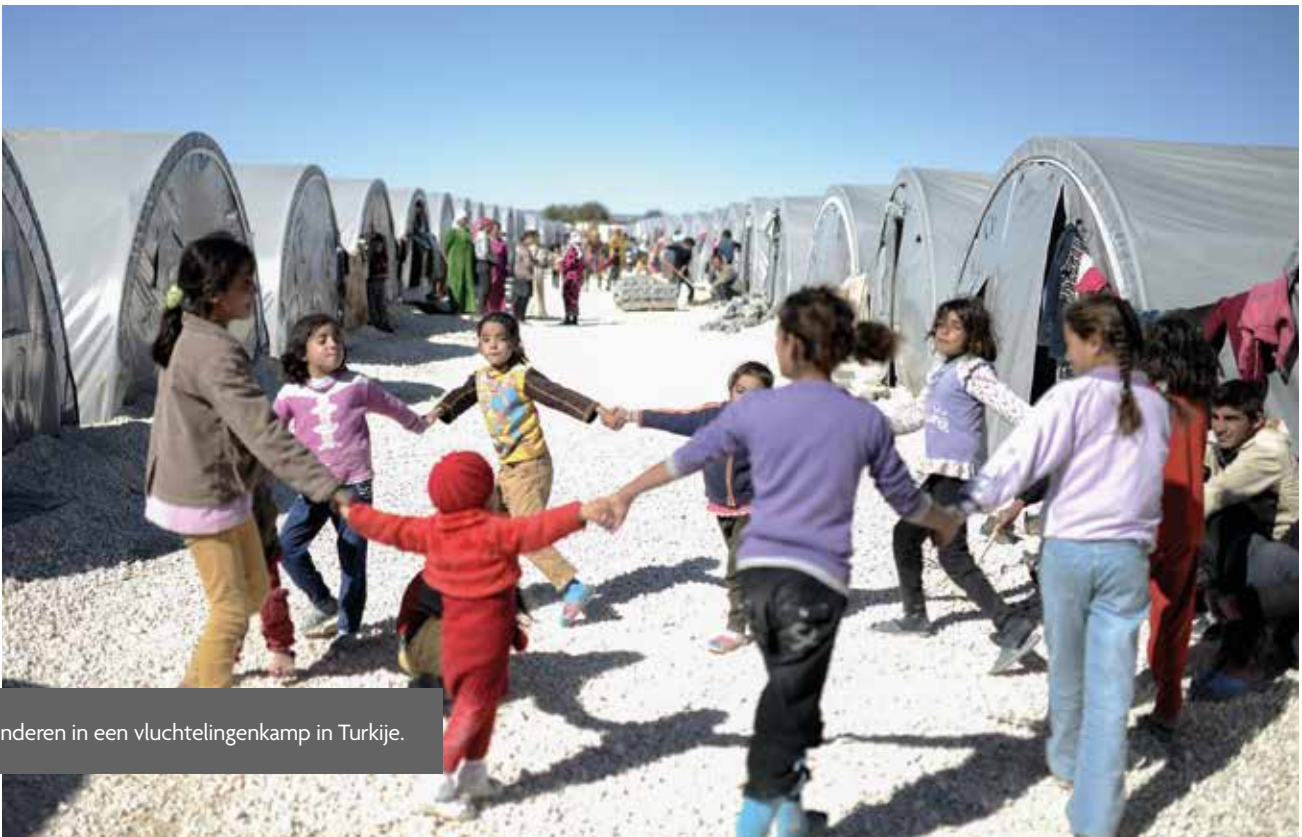
Syrische kinderen in een vluchtelingenkamp in Turkije.

'Denk aan scholing zoals taalles, sport en spel en meer gestructureerde activiteiten die gericht zijn op het versterken van de veerkracht. Die gaan bijvoorbeeld over: hoe los je problemen op? Hoe ga je om met conflict? Hoe communiceer je respectvol? En hoe krijg je meer zelfvertrouwen?'