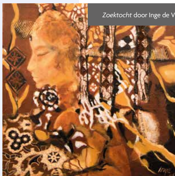
Zoektocht door Inge de Vries.

24 februari jongstleden, precies een jaar na de Russische inval in Oekraïne, is de fototentoonstelling Whispers and Shouts geopend in FOTODOK in Utrecht. Het werk van zes vrouwelijke fotografen en